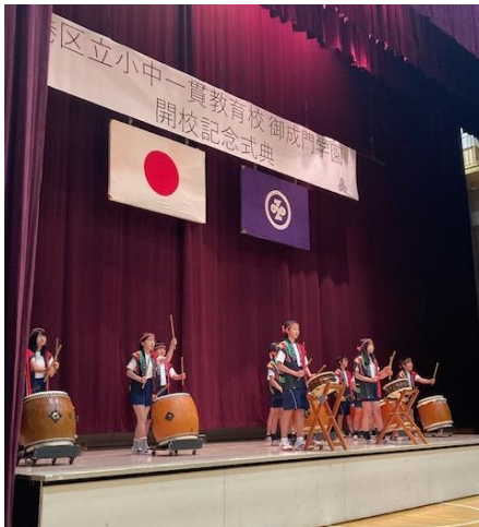
「太鼓クラブの演奏」

第2部では代表児童・生徒の挨拶に始まり、小学5・6年生と中学7年生の太鼓クラブの発表、中学8・9年生のダンス部の発表が行われ会場は大きな拍手に包まれました。